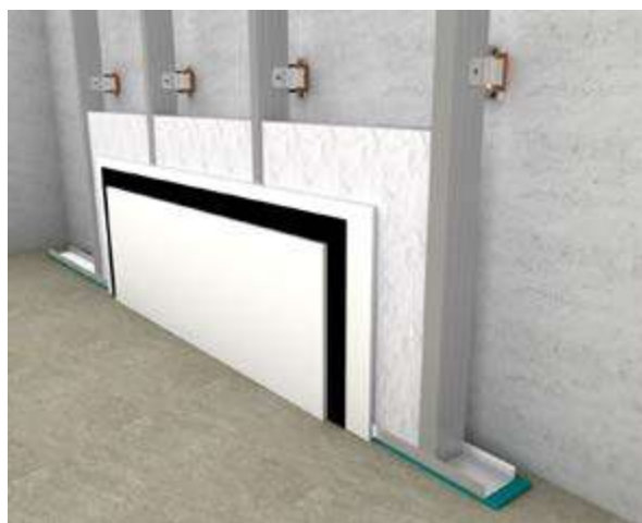
Εφαρμογή iZiFon σε τοιχοποιία ξηράς δόμησης

Η εταιρία μας εφαρμόζει Σύστημα Διαχείρισης Ποιότητας ISO 9001.2008 & Σύστημα Περιβαλλοντικής Διαχείρισης ISO 14001.2004