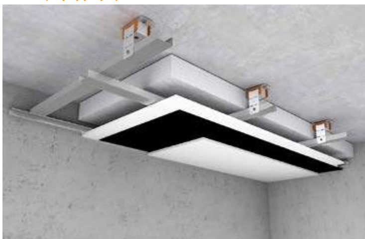
Εφαρμογή iZiFon σε πλωτή οροφή