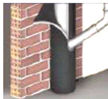
Εφαρμογή ISOLFON-PB : ηχομόνωση σωλήνα αποχέτευσης