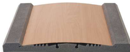
POLYFON-S με διαχυτική μεμβράνη