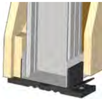
Εφαρμογή Vibro-WS σε πλωτό χώρισμα από γυψοσανίδα

Τα πλευρικά πτερύγια της βάσης του Vibro-WS μπορούν να κοπούν εύκολα, ολόκληρα ή τμήμα τους, στις υπάρχουσες αντίστοιχες εγκοπές. Έτσι μπορούν να εφαρμοστούν σε μικρότερα πάχη επένδυσης (μονή γυψοσανίδα) ή σε επενδύσεις υπαρχόντων τοίχων. Σε όλα τα σημεία στερέωσης πρέπει να τοποθετούνται και μεταλλικές ροδέλες.