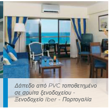
Δάπεδο από PVC τοποθετημένο σε σουίτα ξενοδοχείου - Ξενοδοχείο Iber - Πορτογαλία