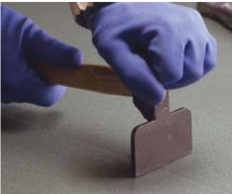
Άσκηση πίεσης στην ένωση μεταξύ των φύλλων

Η επιφάνεια της επικάλυψης πρέπει να πιεστεί με μια ξύλινη σπάτουλα ή με ένα βαρύ μεταλλικό ρολό αμέσως μετά την τοποθέτησή της, με φορά κινήσεων από το κέντρο προς τις άκρες προκειμένου να διασφαλίσετε το πλήρες άπλωμα της κόλλας στην πλάτη της επικάλυψης και να απελευθερώσετε τυχόν εγκλωβισμένο αέρα. Στις περιπτώσεις πολύ λεπτών επικαλύψεων εξασφαλίστε καλή εξομάλυνση του υποστρώματος έτσι ώστε να μην εμφανιστούν ζάρες στην επιφάνεια της επικάλυψης. Το δάπεδο είναι έτοιμο για ελαφριά κυκλοφορία μετά από 3-5 ώρες (ανάλογα με τη θερμοκρασία του περιβάλλοντος και την απορροφητικότητα της επιφάνειας). Η Ultrabond Eco V4 SP σκληραίνει εντελώς μετά από 48-72 ώρες.