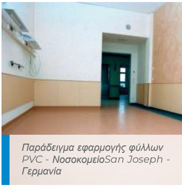
Παράδειγμα εφαρμογής φύλλων PVC - Νοσοκομείο San Joseph - Γερμανία